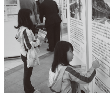
クイズラリーの様子 (7/5,6 登場予定!)

※そのほか、身近な土木を描く図画コンクールの展示や防災グッズ・中国地方整備局の展示、遊びの広場として図書・塗り絵体験も実施しております。