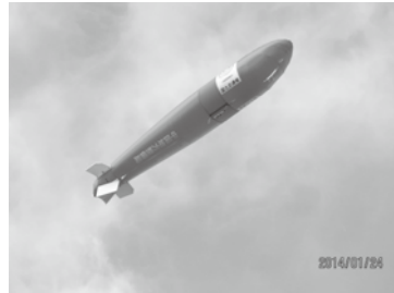
気球空撮システム (7/6 登場予定!)

安全、安心なまちをつくり、守るため、土木の世界で使われるいろいろな機器を実演紹介します。