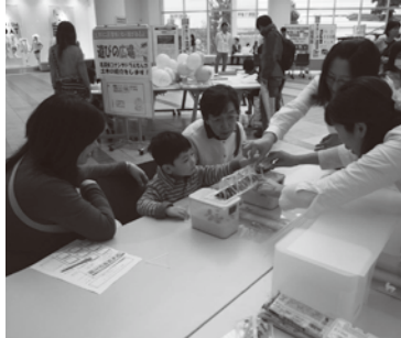
橋の模型実験 (7/5,6 登場予定!)

“じょうぶな橋の作りかた”、“強いトンネルの形”など、見て、聞いて、さわって、土木を実感してみましょう。