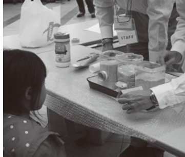
トンネル実験 (7/5,6 登場予定!)