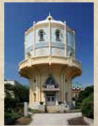
水戸市低区排水塔 昭和7年竣工 水戸市