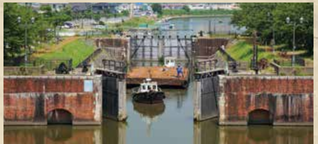
横利根開門 大正10年竣工 稲敷市

環境や技術、デザインなど、はっと目が奪われる、未来を見通した土木事業のこれからを感じてもらえるような新しいコンセプトの現代のプロジェクトを展示します。