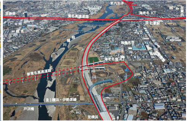
写真 見学先の海老名南 JCT 付近 横浜国道事務所ホームページより