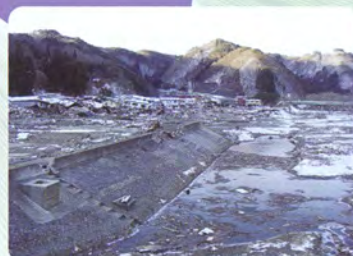
津波により被災した岩泉町小本地区