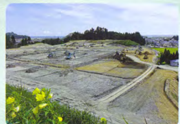
野田村城内高台築造工事の様子