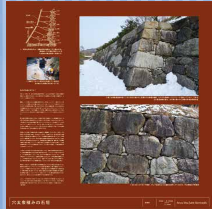
EYESパネル/穴太衆積みの石垣