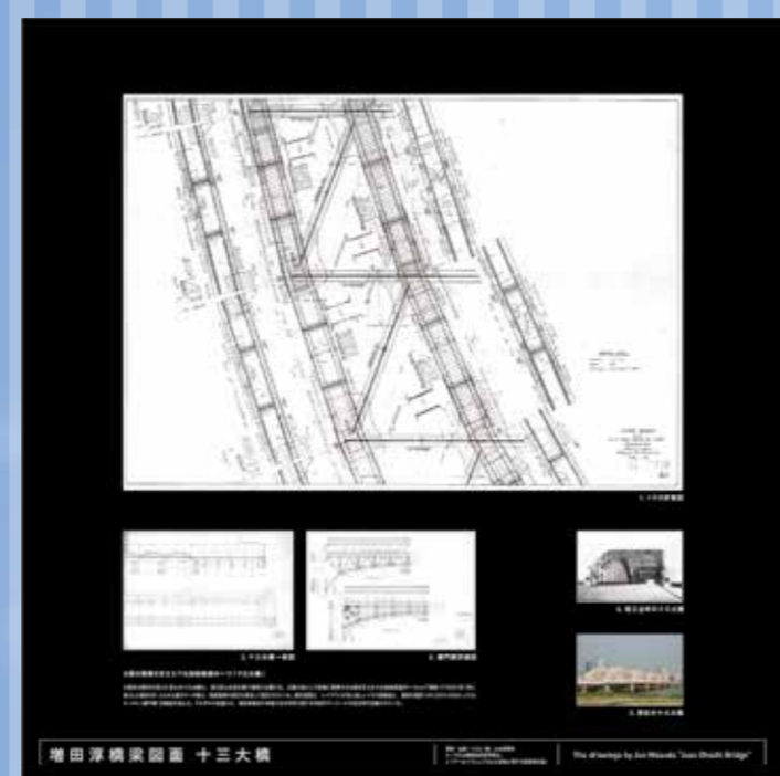
HANDSパネル/増田淳橋梁図面 十三大橋