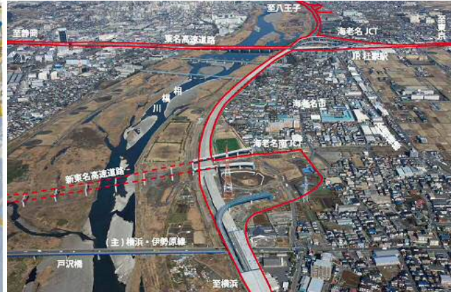
写真 見学先の海老名南 JCT 付近 横浜国道事務所ホームページより